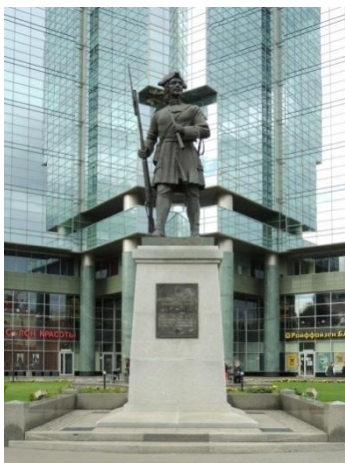
памятник гвардейцу Семёновского полка в Москве

Также гвардия играла важную роль в политике ряда стран. Например, в Древнем Риме преторианская гвардия неоднократно свергала и возводила на престол императоров, в России в эпоху дворцовых переворотов гвардия, и, в частности, лейб-компания, играла в большинстве из них ключевую роль.