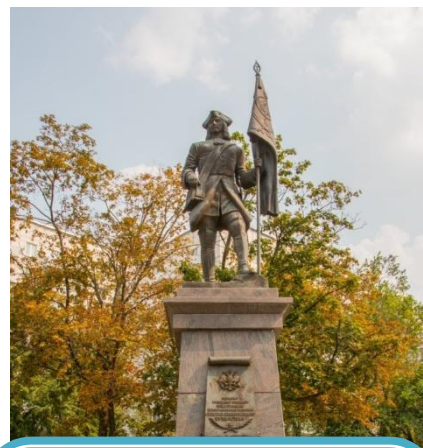
Памятник первому гвардейцу Преображенского полка Сергею Бухвостову в Москве

Впоследствии численность русской Лейб-гвардии значительно возросла, а состав её неоднократно расширялся. К 1913 году (накануне Первой мировой войны) Лейб-гвардия императора Николая II включала в себя: три гвардейские пехотные дивизии, две гвардейские кавалерийские дивизии, одну Отдельную кавалерийскую бригаду и ряд дополнительных подразделений, в том числе Собственный Его Императорского Величества Конвой (конная охрана императора) и Роту дворцовых гренадер, выполнявшую функции внутренней церемониальной дворцовой стражи.