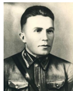
Герой Советского Союза Николай Иванович Кузнецов

За образцовые выполнения заданий командования в тылу противника и проявленные при этом мужество и героизм Дмитрию Николаевичу Медведеву указом Президиума Верховного Совета СССР от 5 ноября 1944 года было присвоено звание Героя Советского Союза. Он был награжден четырьмя орденами Ленина,