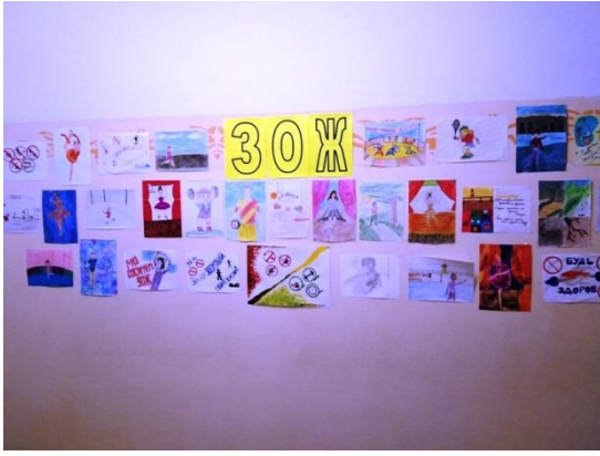
Выставка рисунков «Спорт-это здорово»,