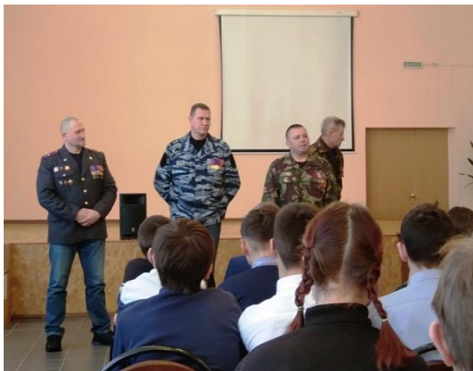
Встреча с сотрудниками ОМОН УМВД России по Брянской области