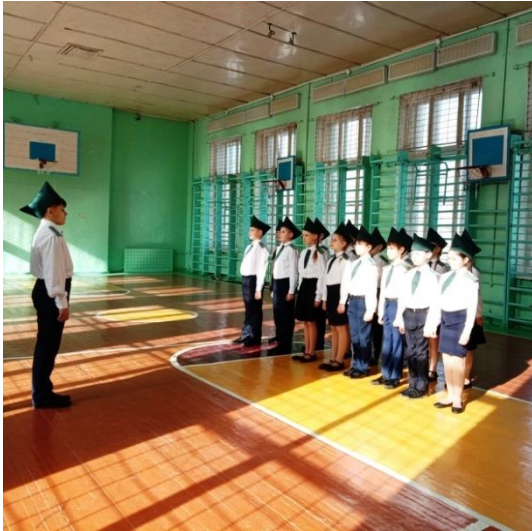
Военно-спортивная игра "Зарничка",